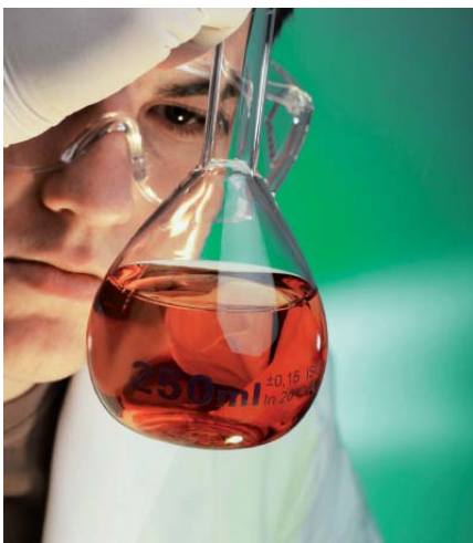
Der Bantleon-Service umfasst die komplette Pflege und Wartung von Maschinen und Fluiden. Bei Toleranzverletzungen und Überschreitung der Wartungsterminen schlägt das System Alarm.

SCHMIERSTOFFE Das Fluidmanagement KSS-Online der Hermann Bantleon GmbH ermöglicht es, bei der Qualitätskontrolle und -sicherung von Kühlschmierstoffen die Kostenentwicklung im Blick zu behalten und maßgeblich zu steuern.